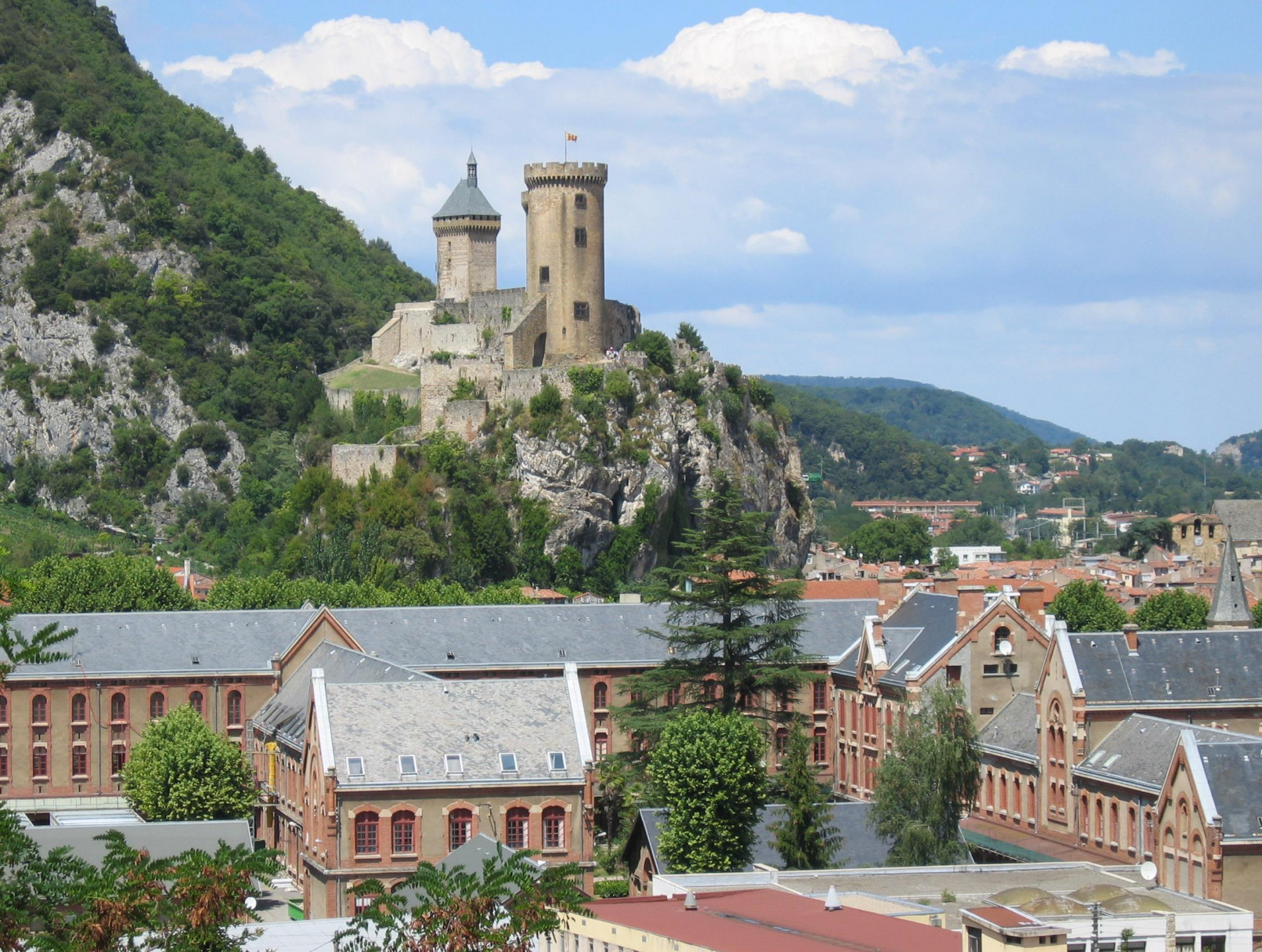
Abadía de San Volusiano.