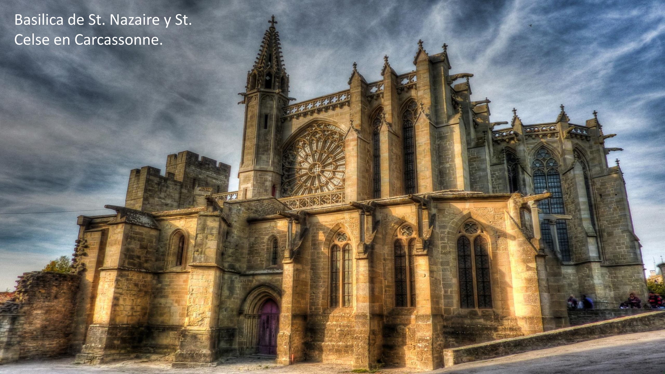
Basilica de St. Nazaire y St. Celse en Carcassonne.