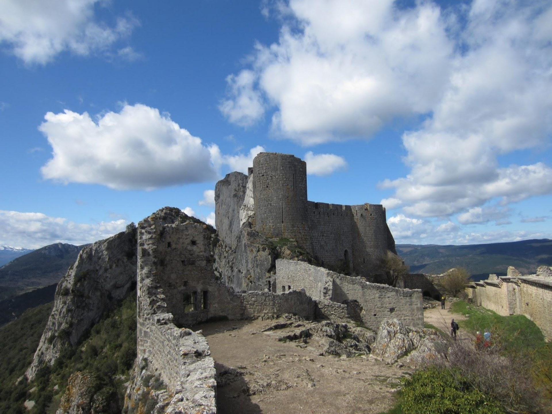
Château de Peyrepertuse