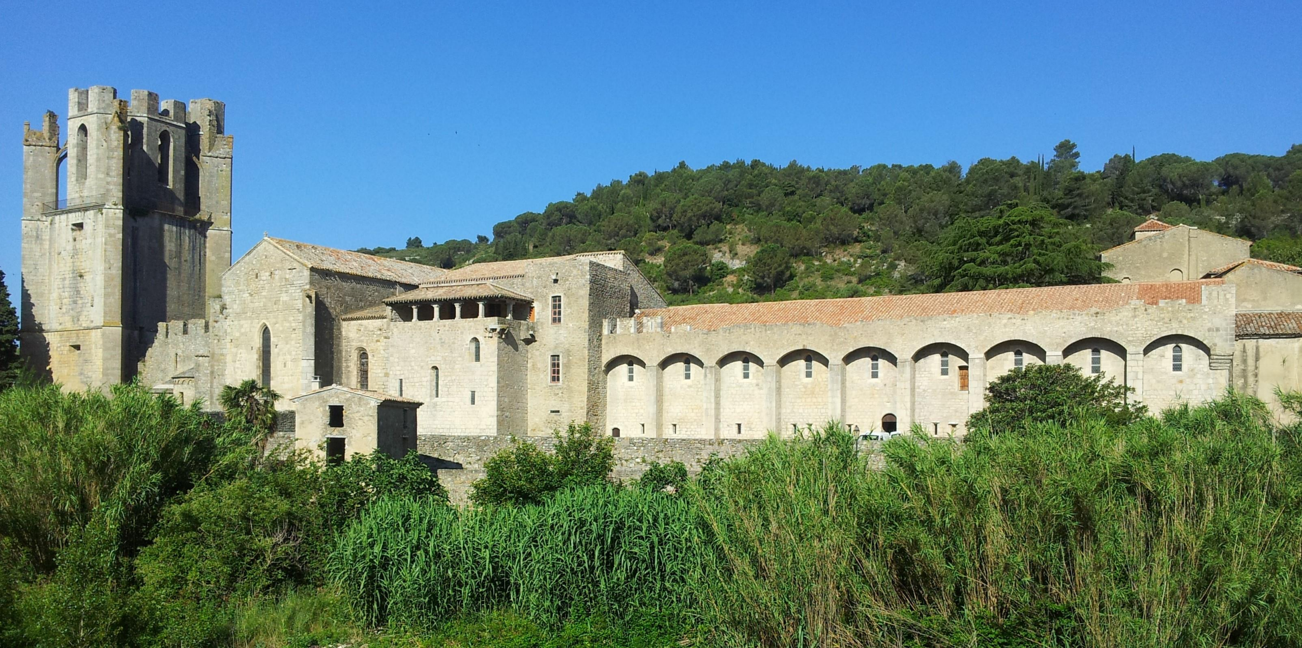
Abadía de Santa María de Lagrasse