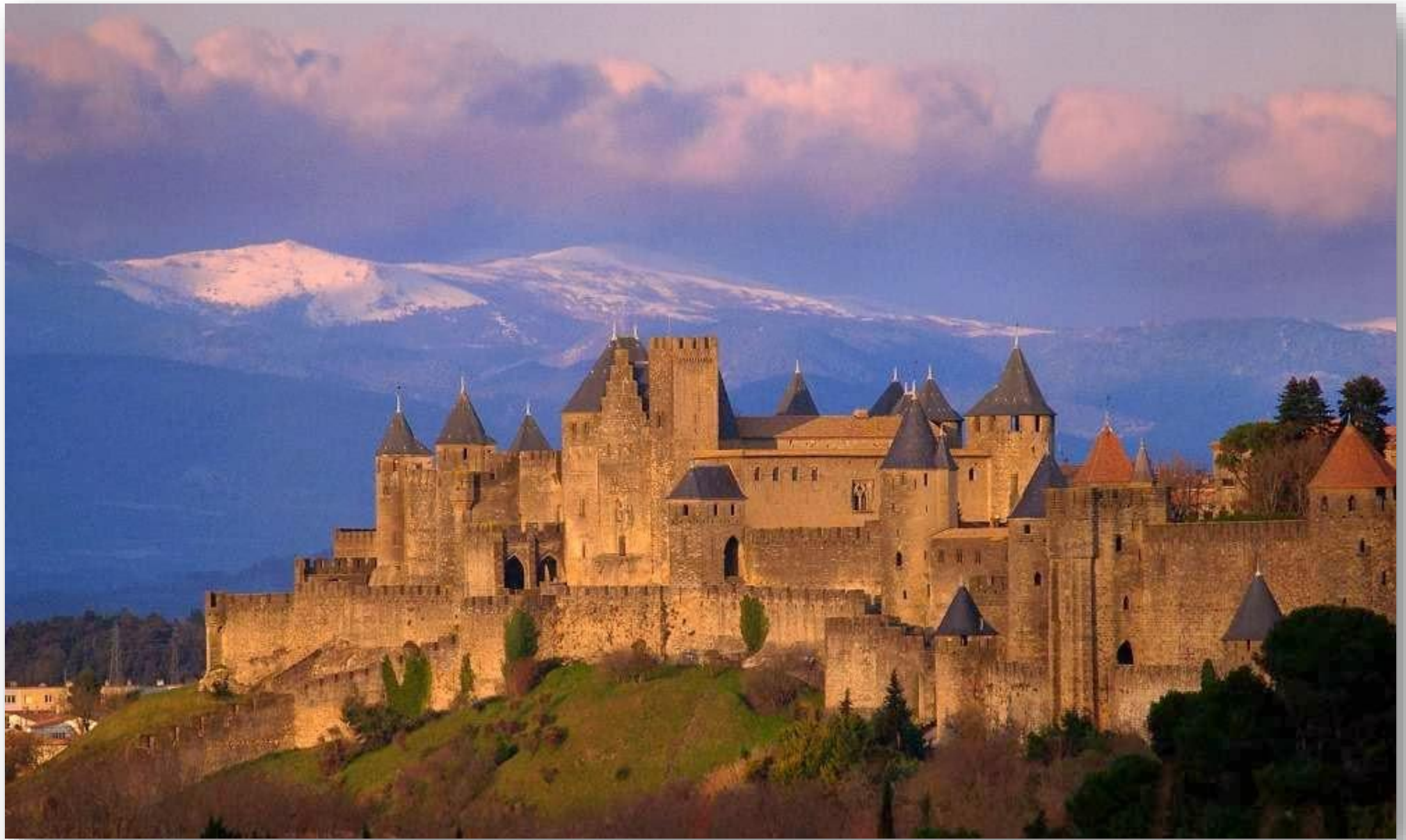
La ciudad de Carcassonne